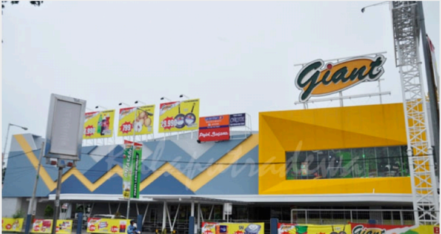
Giant Antasari

BANDAR LAMPUNG -- Giant-Giant yes!!! Suara itu terdengar dengan lantang dari kerumunan anak-anak yang berseragam pramuka yang dipandu oleh irwan selaku pemandu kegiatan. Irwan yang memandu anak-anak untuk memperkenalkan dan memberitahu manfaat barang-barang jualan yang ada di Giant. Sabtu, (15/8/2015).