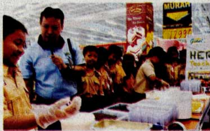
BUAT DONAT: Siswa SD Paku Jaya belajar membuat donat dari pegawai Giant Ekstra Alam Sutera.

Program yang sudah berjalan sejak 2012 tahun lalu ini sangat efektif dalam menyalurkan kegiatan Corporate Social Responsibility (CSR). Sejauh ini, melalui program Giat, sebanyak 174 unit took Giant telah membangun satu sekolah di sekitar areanya. Pembangunan bisa