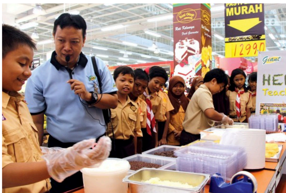
Hero Teaching yang digelar Giant. (kan)

Diterbitkan Selasa, 18 / 08 / 2015 13:48